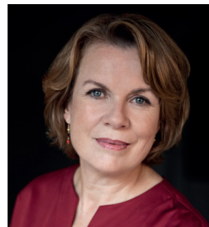
Bernarda Fink Canto