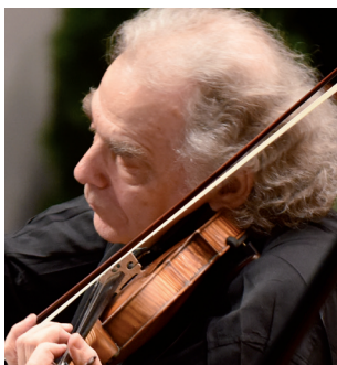
Zakhar Bron Violín