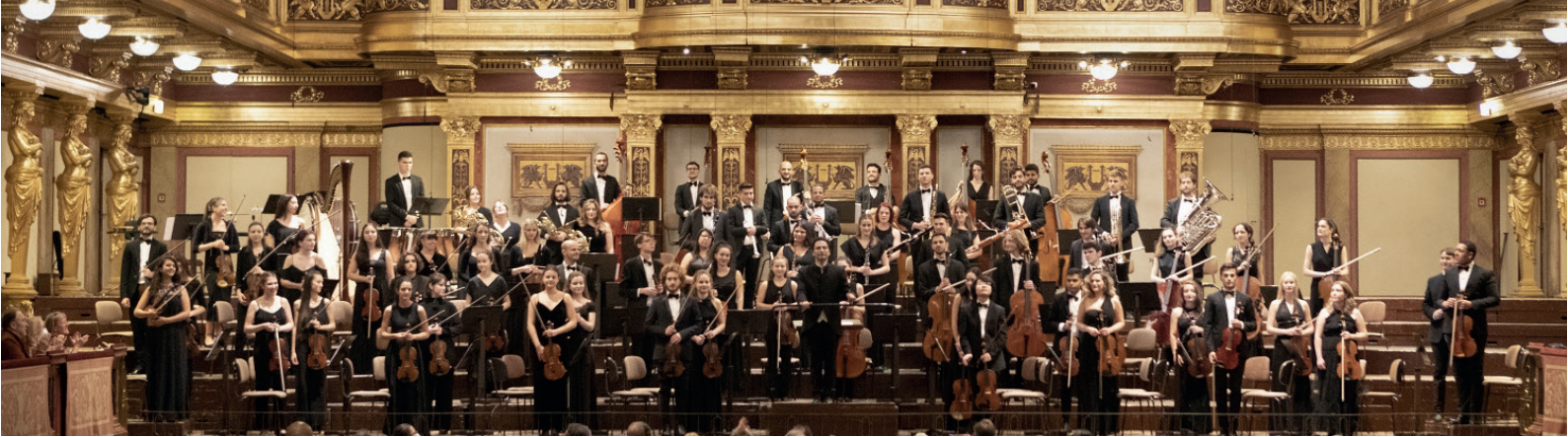
Andrés Orozco-Estrada con la Orquesta Sinfónica Freixenet. Gira 30 aniversario de la Escuela. Musikverein, Viena. Octubre 2021